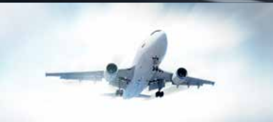
LUFT- UND RAUMFAHRT, MARINE UND EISENBAHN