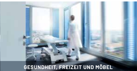
GESUNDHEIT, FREIZEIT UND MÖBEL