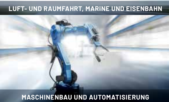
MASCHINENBAU UND AUTOMATISIERUNG