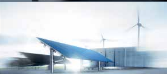
ENERGIE UND BAUWESEN